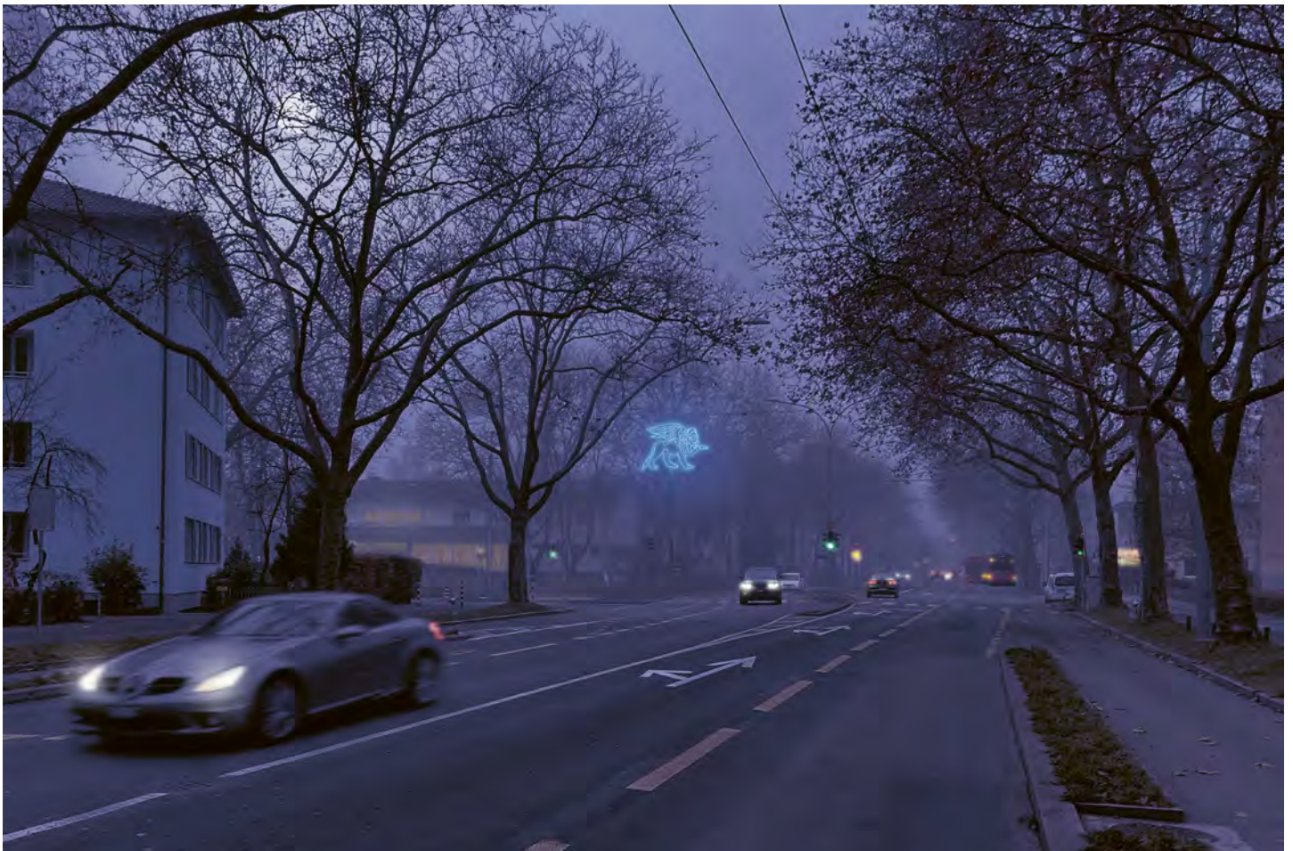
Neonlöwe – auf dem Weg zu den Leuten, auf der Suche nach dem Leben.